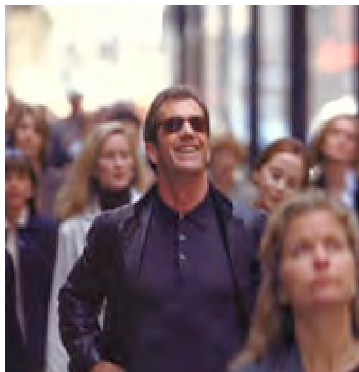
Ce que veulent les femmes